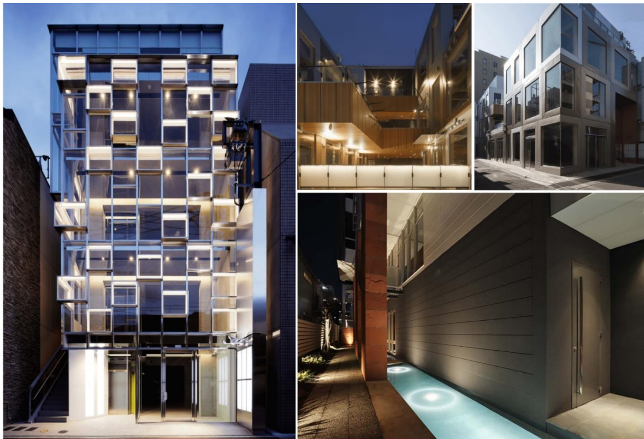
左から：DAIMYO BEAUTY COMPLEX（福岡市中央区大名, 2010年グッドデザイン賞）、D.SIDE（福岡市中央区天神）、ASCOT TERRACE（福岡市中央区西中洲）

https://ascotcorp.co.jp/business/office_commercial/