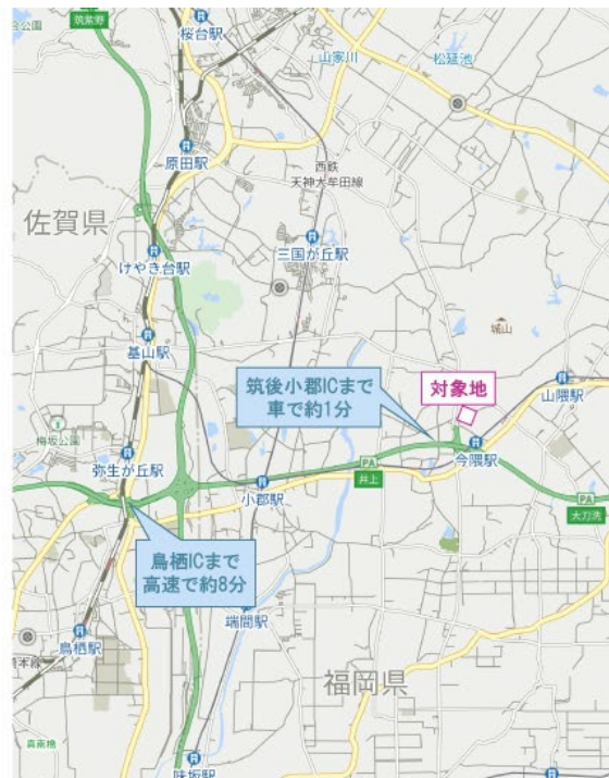
大分自動車道 筑後小郡 IC 至近の優良地、福岡市内へも車移動で約 30 分