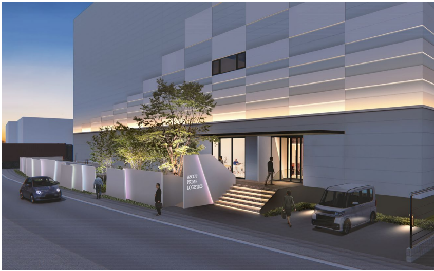
物流倉庫イメージパース： ASCOT PRIME LOGISTICS アスコットプライムロジスティクス

アスコットは中長期的な成長を見据え、新しい経営体制のもと新規事業を開始しています。創業からの主力事業を展開する不動産開発事業本部に加え、不動産投資事業本部、国際事業本部、不動産ファンド事業本部を新設し、総合不動産サービスプロバイダーを目指しています。不動産投資事業本部では東京・大阪・名古屋など大都市圏における「ラストワンマイル」の一端を担う物流施設開発を中心に様々な施設への投資事業、国際事業本部では海外投資家向けの開発・仲介・投資事業、不動産ファンド事業本部では国内外投資家との共同投資や私募ファンドの組成・不動産投資信託事業・様々な施設に対するアセットマネジメントを展開しています。