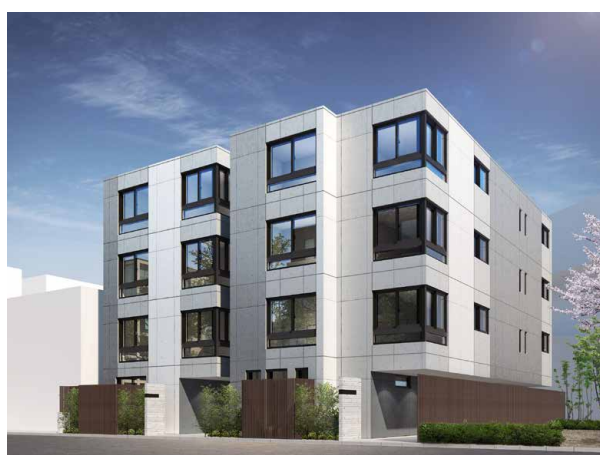
※外観イメージパース

当マンションは従来の“猫が飼える家”の一步先を見据え、“猫と住まい手の双方が快適に暮らせる家”をコンセプトとしたデザインコンパクトマンションです。猫は一匹だけでなく数匹と暮らせるよう、猫にとっても人にとっても心地よい空間づくりを目指し、随所に工夫を凝らしています。