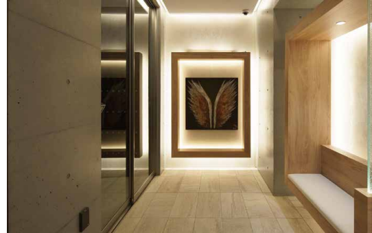
【1階エントランスホール】 街からそれぞれの住まいへと、一步入ると気持ちをスイッチさせてくれる憩いの場所。白と木調のコントラストがひとときの安らぎをもたらす。