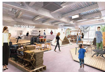
ショップイメージ