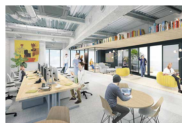
オフィスイメージ